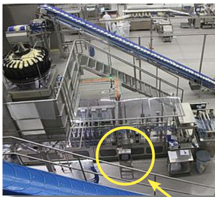
Produktionslinie mit Hitachi-Drucker